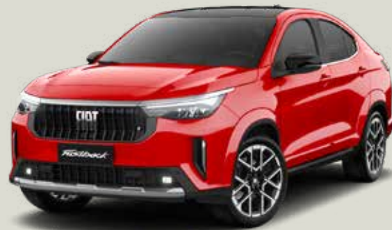
663 | ROJO MONTECARLO + NEGRO VULCANO