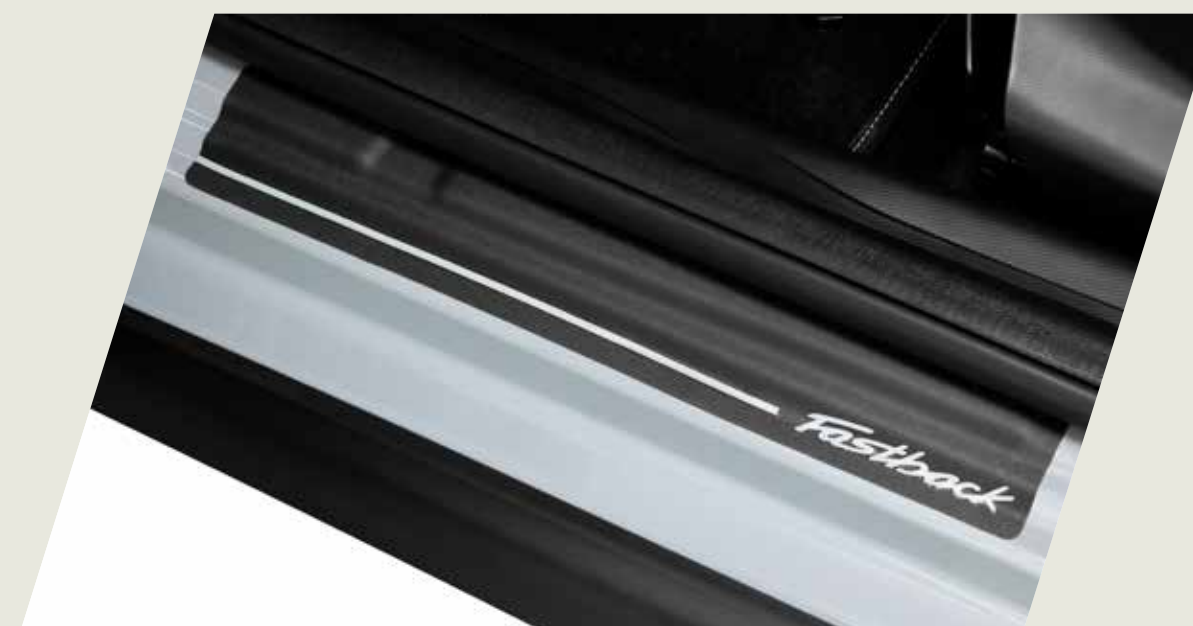
PROTECTOR DE ZÓCALO - VINILO