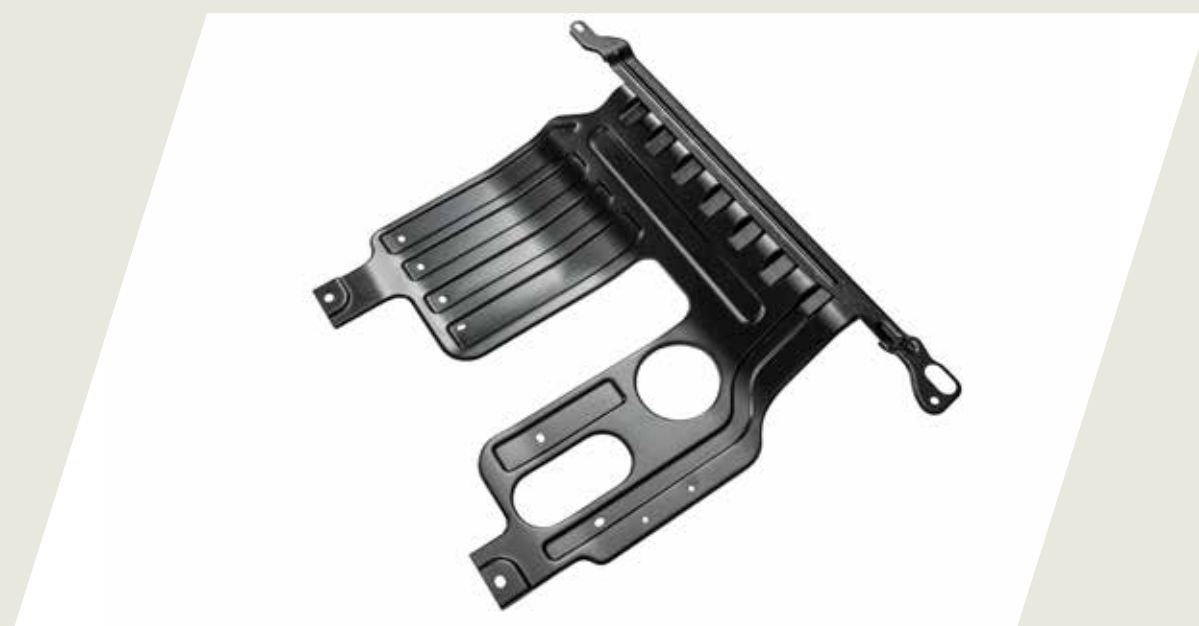
PROTECTOR DE CARTER