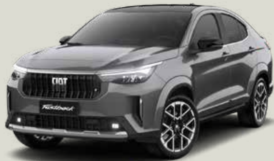
175 | GRIS SILVERSTONE + NEGRO VULCANO