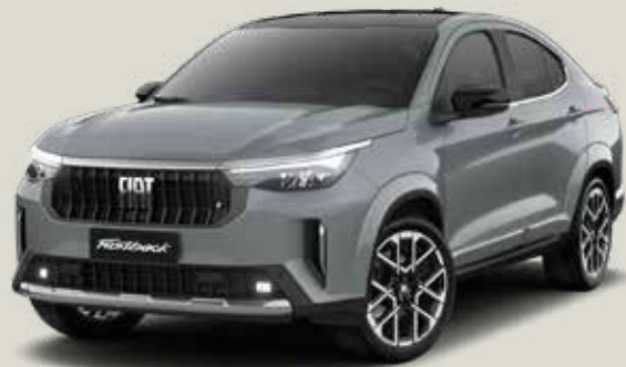
766 | GRIS STRATO + NEGRO VULCANO