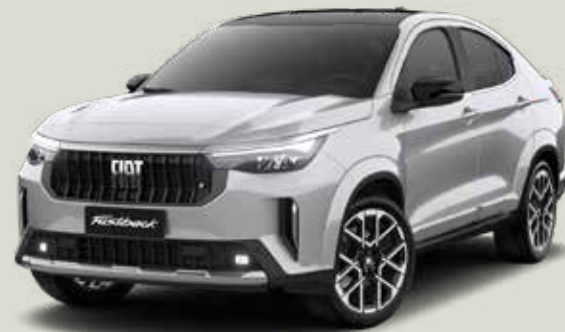
832 | PLATA BARI + NEGRO VULCANO