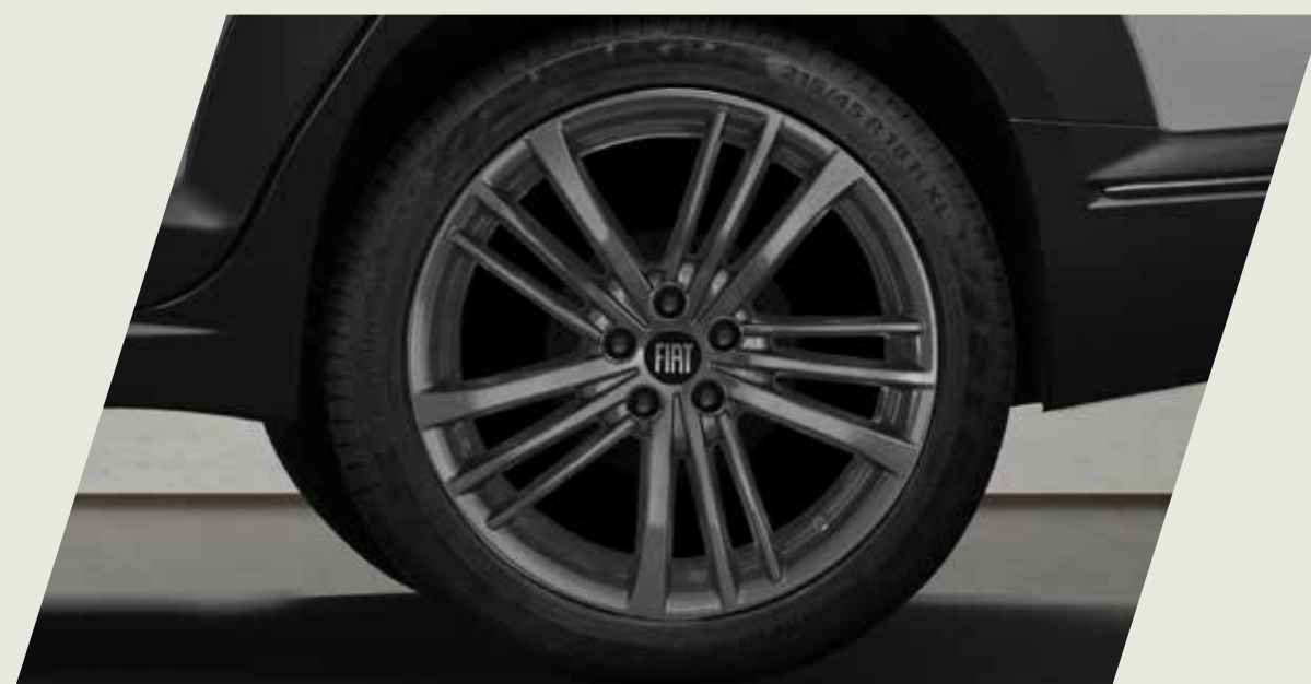
LLANTAS DE ALEACIÓN DE 17", TAMAÑO 6, COLOR EXCLUSIVO

Acercate a un concesionario y conocé la gama de accesorios originales que Mopar te ofrece para equipar tu FIAT Fastback, seguido de las imágenes de cada accesorio.