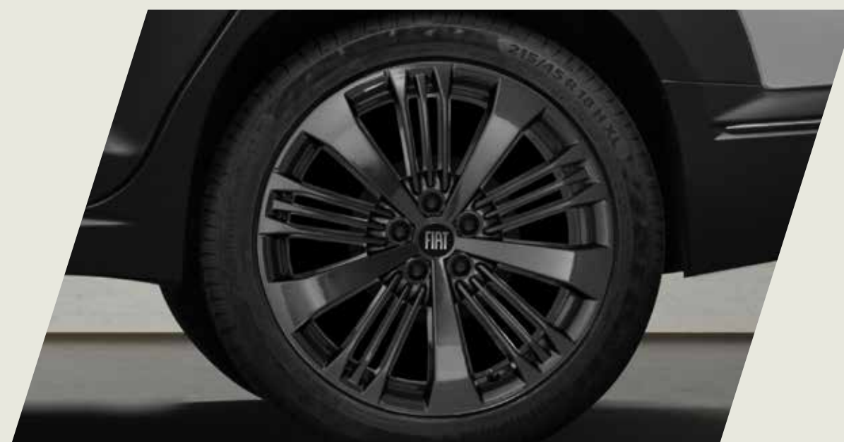
LLANTAS DE ALEACIÓN DE 17", TAMAÑO 7, COLOR EXCLUSIVO