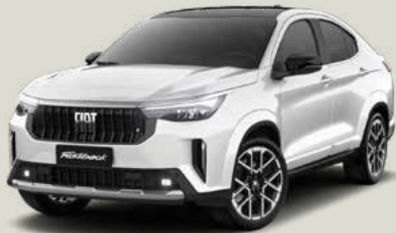
743 | BLANCO BANCHISA + NEGRO VULCANO