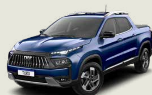
345 - Azul Jazz