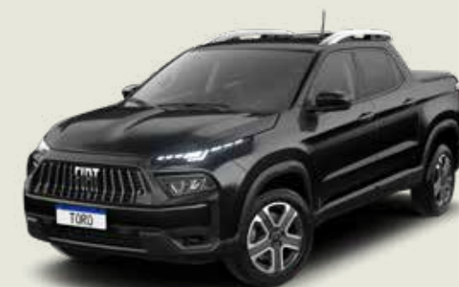
852 - Negro Carbono