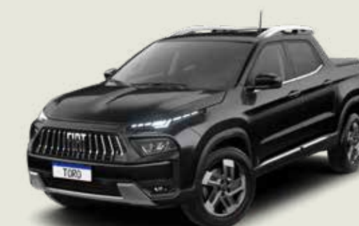
852 - Negro Carbono