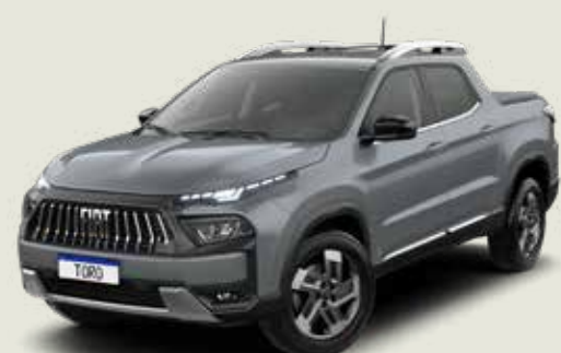
503 - Gris Sting