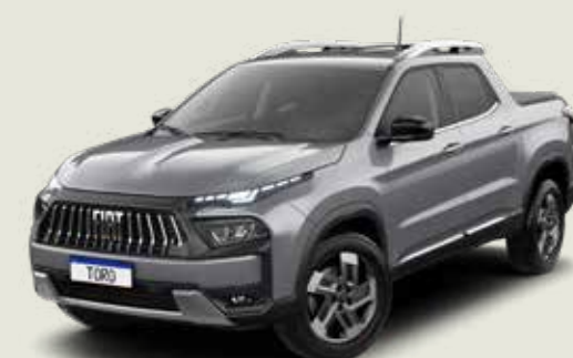
097 - Billet Silver