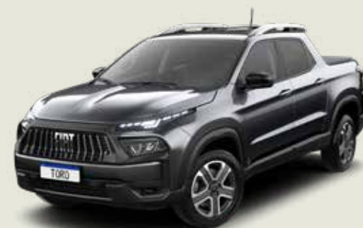
847 - Gris Granito