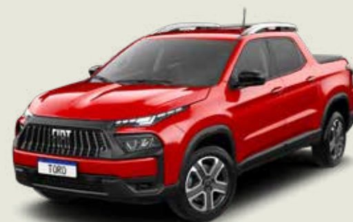
176 - Rojo Tribal