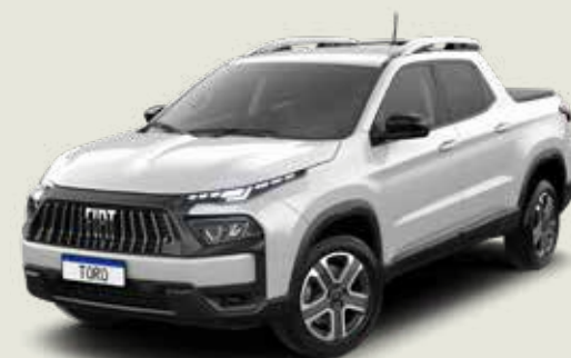
296 - Blanco Ambiente