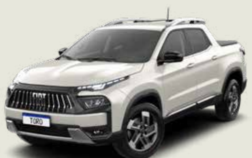
742 - Blanco Polar