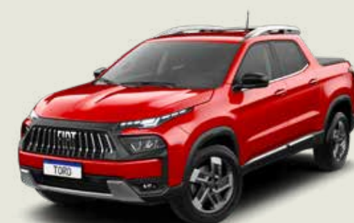
176 - Rojo Tribal