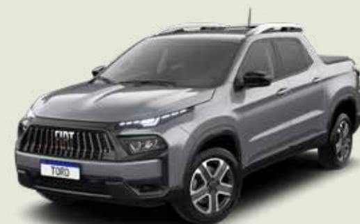
097 - Billet Silver