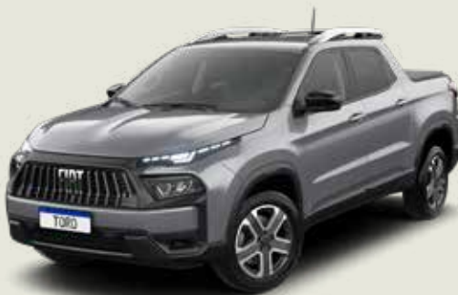
097 - Billet Silver