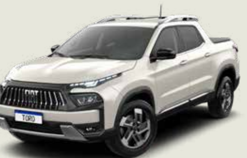
742 - Blanco Polar