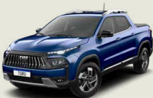
345 - Azul Jazz