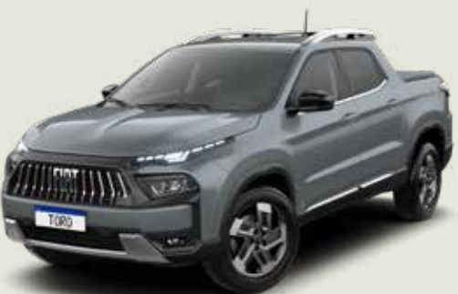
503 - Gris Sting