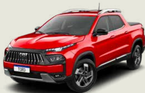
176 - Rojo Tribal