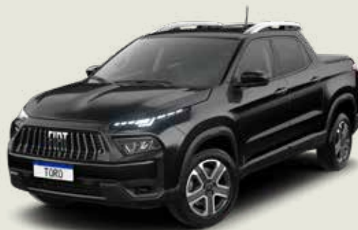
852 - Negro Carbono