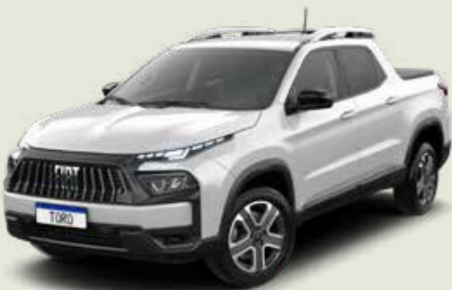
296 - Blanco Ambiente