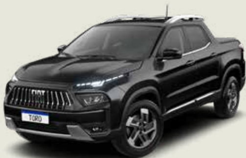
852 - Negro Carbono