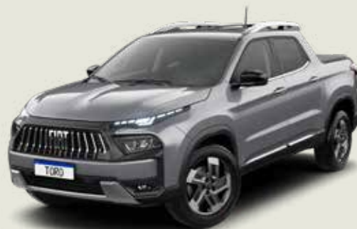
097 - Billet Silver