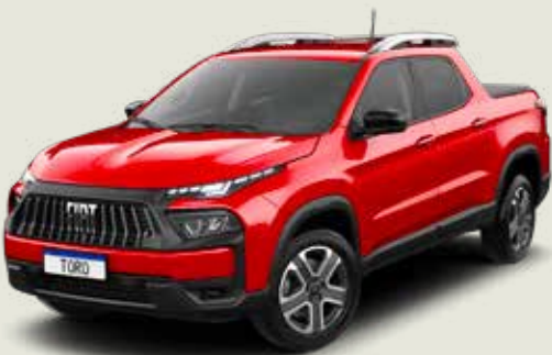
176 - Rojo Tribal