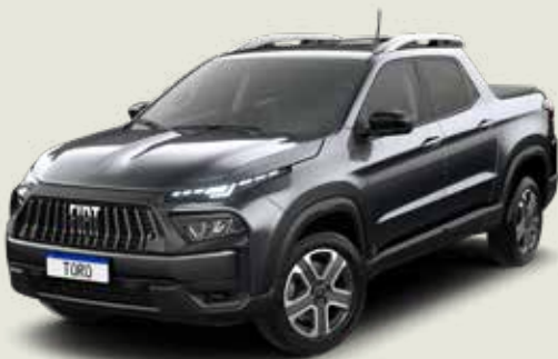
847 - Gris Granito