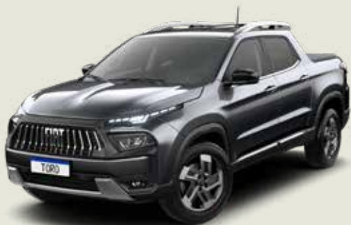
847 - Gris Granito